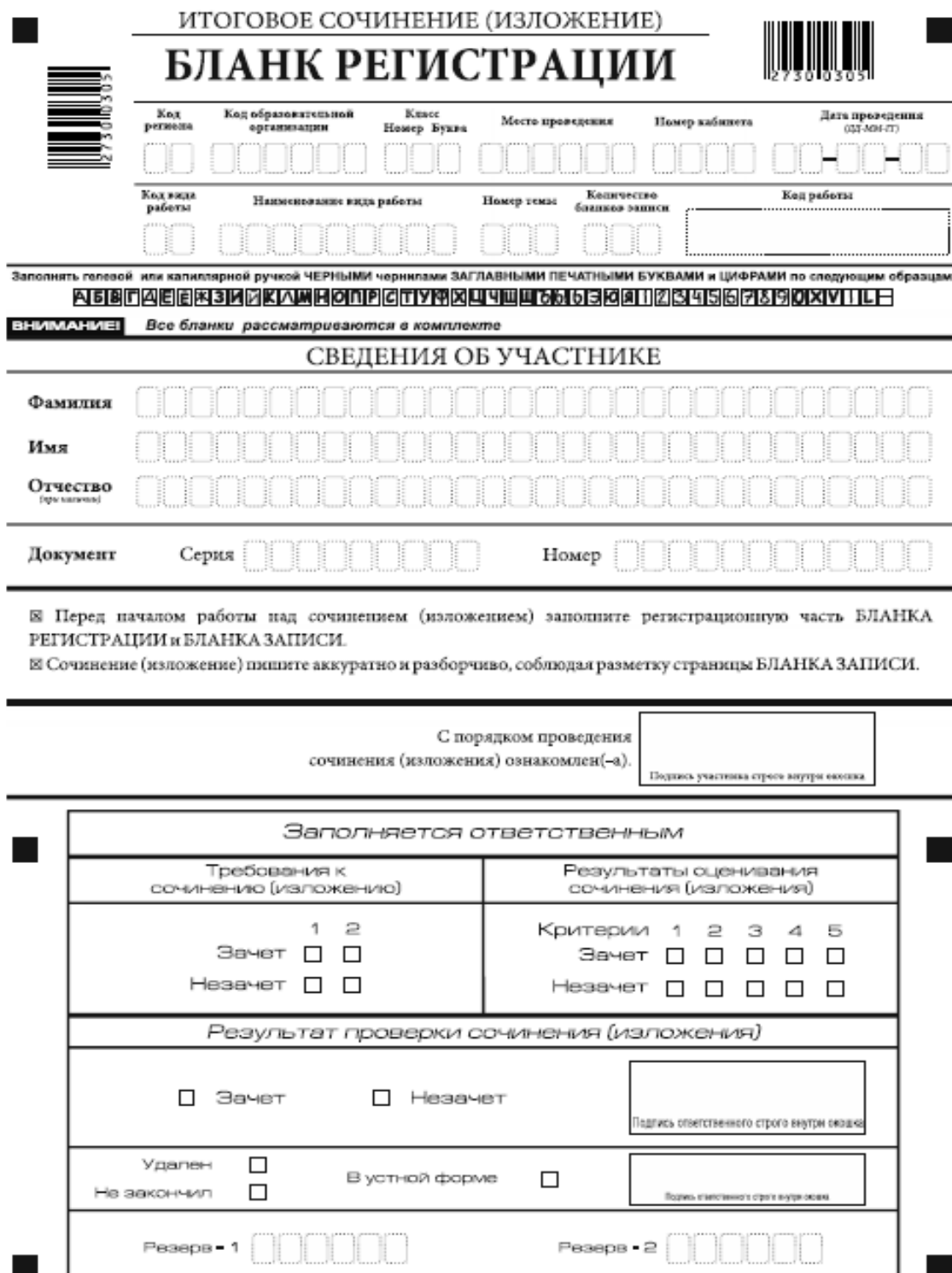
Рис. 1. Бланк регистрации

В верхней части бланка регистрации (рис. 2) расположены: